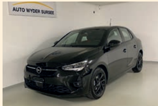
Corsa 1.2 Turbo GS-Line Manuell

1. Inverkehrsetzung: 30.06.2021 12'800 km CHF 23'800.-