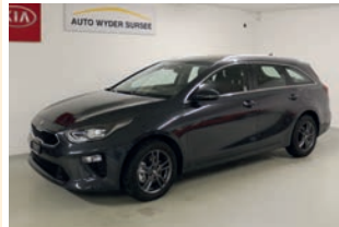
Ceed Kombi 1.4 Power Automat

1. Inverkehrsetzung: 21.01.2021 10'000 km CHF 31'450.-