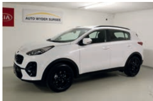
Sportage 1.6 Black Edition 4x4 Automat

1. Inverkehrsetzung: 30.03.2021 5'000 km CHF 32'500.-