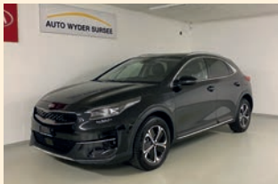
XCeed 1.6 Plug-in Hybrid Style Automat

1. Inverkehrsetzung: 29.10.2021 10'000 km CHF 34'900.-