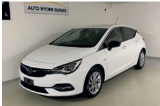
Astra 1.4 Turbo Elegance Automat

Unsere Occasionsfahrzeuge werden mit Liebe zum Detail aufbereitet. Sie sind ab MFK und mit Garantie ausgestattet. Nachfolgend ein paar Beispiele aus unserem Occasionsangebot: