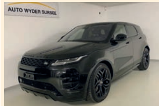
Range Rover Evoque 2.0 4x4 Automat / 300 PS

1. Inverkehrsetzung: 07.06.2019 66'000 km CHF 55'900.-